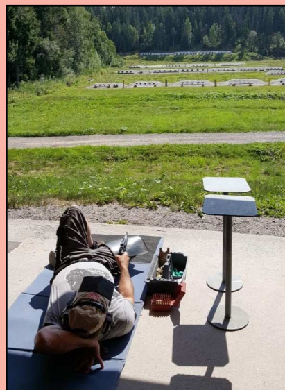
Die typische liegende Position „Dead Frog“, die eine sehr lange und genaue Visierlinie bietet.

Beim Silhouetten-Schießen wird auf spezielle Stahlziele in Tierform (Huhn, Schwein, Truthahn und Widder) geschossen, und zwar auf jeweils unterschiedliche Entfernungen. Die Auswertung ist ganz einfach: nur eine umgeworfene Figur zählt als Treffer, ein Wettkampf geht über 40 Schuss.